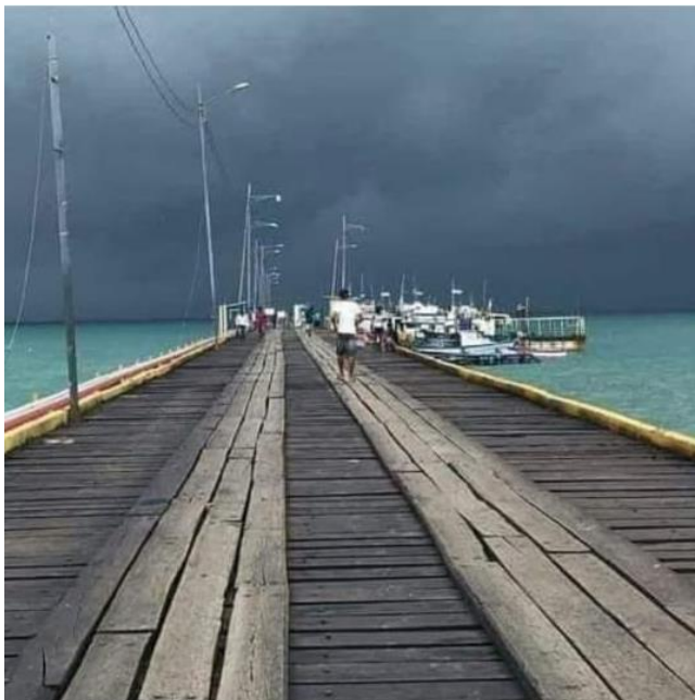
Bilwi een paar uur voor aankomst van de orkaan Eta

En dan komen er in november ook nog vlak achter elkaar twee zware orkanen over Nicaragua razen, over grotendeels dezelfde zone. Eerst de orkaan Eta en daarna Iota. Ze kwamen aan de Atlantische kust, bij Bilwi (Puerto Cabezas) aan land, en raasden over het noordelijk deel van Nicaragua. De schade is enorm, vooral voor de inheemse gemeenschappen.