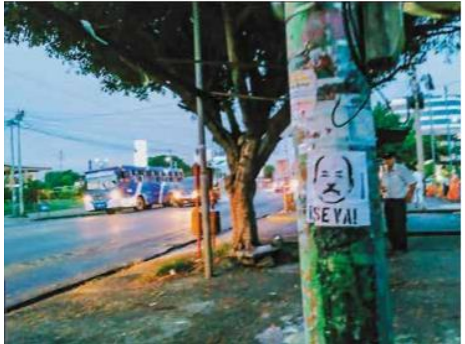
Protesteren is in 2018 bij wet verboden, Nicaraguanen laten op andere manieren weten dat Ortega moet gaan (¡SE VA!).

Ook voor Nicaragua was 2020 een moeilijk jaar. Politiek gezien is het nog steeds onrustig. In april 2018 kwamen jongeren in opstand tegen het beleid van de regering, waarop deze met harde hand reageerde. Daarna kwamen grote delen van de bevolking in beweging en zijn er massale demonstraties gehouden. In 2020 is er nog steeds veel repressie vanuit de regering, veel controle door de politie en worden tegenstanders van het regime zonder reden opgepakt en gevangen gezet. Eind 2020 zaten er 109 politieke gevangenen vast.