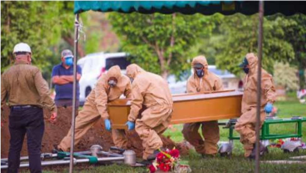
Een begrafenis midden juni op een begraafplaats net buiten Managua

Geen maatregelen dus ter voorkoming van besmettingen door de overheid, geen lock-down want dat kan de economie niet aan, volgens Ortega, en ook geen steunpakketten. De economie had al een flinke dreun gekregen door de onstabiele sociale en politieke situatie. Door corona ligt het toerisme dat net weer een stijgende lijn vertoonde, geheel stil. Aangezien het overgrote deel van de Nicaraguanen in de informele sector werkt zijn de gevolgen groot. Volgens cijfers van de NGO Funides leeft in 2020 29,9% van de bevolking in armoede, in 2017 (dus voor de onlusten) was dat 20,3%.