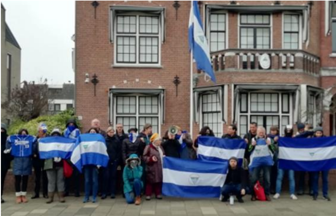
Demonstratie bij de Nicaraguaanse ambassade in Den Haag, op 24 november 2019

In november zijn twee bestuursleden van DOS op werkbezoek geweest naar onze zusterstad, La Libertad. Vanaf Managua ligt dit stadje op een kleine drie uur rijden richting het oosten, de bergen in. Dus op enige afstand van de grote steden. In december 2018 waren we er ook en in vergelijking met toen was de sfeer nu minder gespannen. Zo waren de paramilitairen niet meer aanwezig en zag je weinig politie op straat. De situatie in het land was wel hét onderwerp van gesprek, maar dan alleen in 1 op 1-gesprekken, als men zeker wist dat er verder niemand mee kon luisteren. De onderlinge tegenstellingen blijven voelbaar. Positief is dat bij onze counterpart, de Fundación Crecemos Juntos, meerdere politieke stromingen vertegenwoordigd zijn.