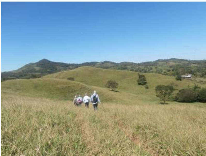
Op weg naar een van de boerderijen die in aanmerking komen voor zonnepanelen

Het gezondheidscentrum had het verzoek voor een echo-apparaat ingediend. Tijdens het werkbezoek heeft de directeur onze vragen hierover op een duidelijke manier beantwoord. We waren alleen vergeten te vragen of er verdiepingscursussen gegeven worden voor de artsen die het vorige echo-apparaat gewerkt hebben, omdat er met het nieuwe apparaat veel meer kan dan met de vorige. De directeur geeft aan dat hij de artsen op stage zal sturen bij een ziekenhuis waar ze met een soortgelijke apparaat werken.